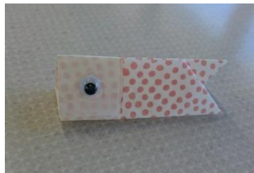
写真3 土居さんが紙で折ったこいのぼりを 皆さんにプレゼントしてくれました