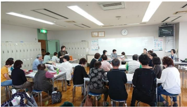
写真 1 : 総会の様子